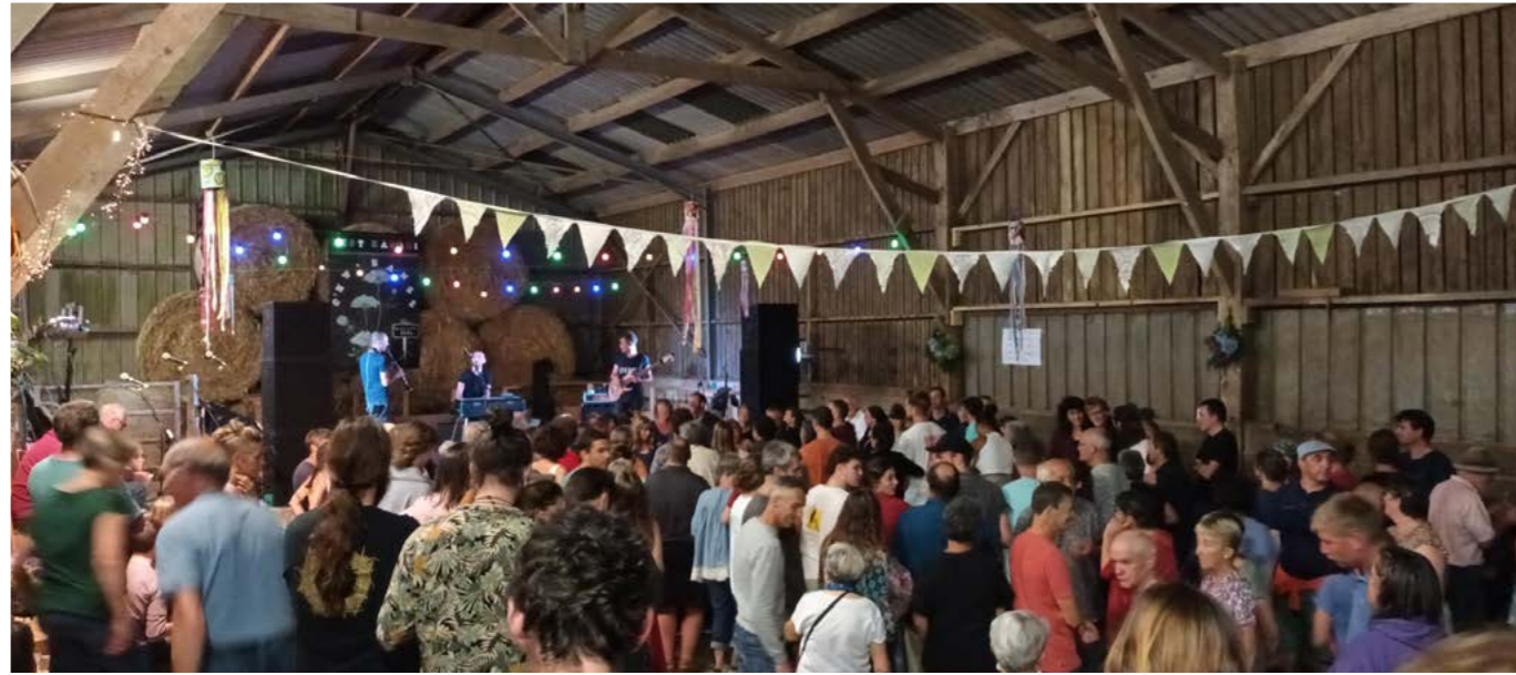
Le goupe Fleuves lors du fest Kardi de Kerbescontes