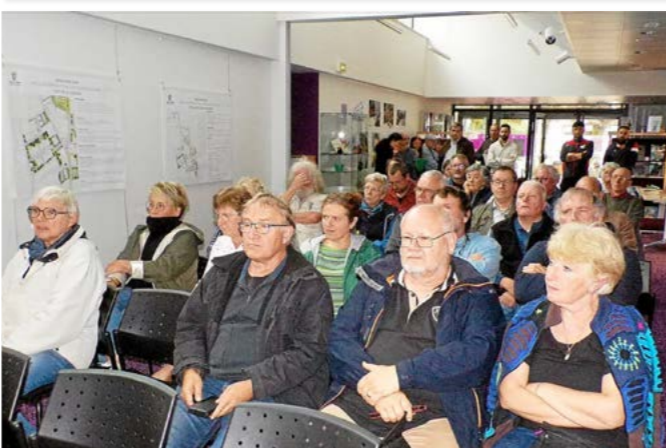
Présentation publique du schéma de développement