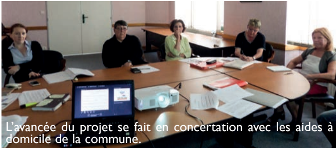
L'avancée du projet se fait en concertation avec les aides à domicile de la commune.

Il permettra également d'améliorer la qualité de prise en charge des usagers, d'étendre l'offre des services et de développer la professionnalisation des agents.