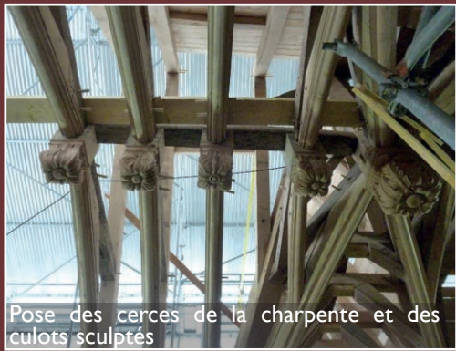
Pose des cerces de la charpente et des culots sculptés