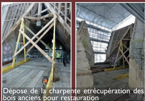
Dépose de la charpente et récupération des bois anciens pour restauration

Le suivi de son travail est disponible à l'adresse suivante : illustration-nature-patrimoine.blogspot.fr