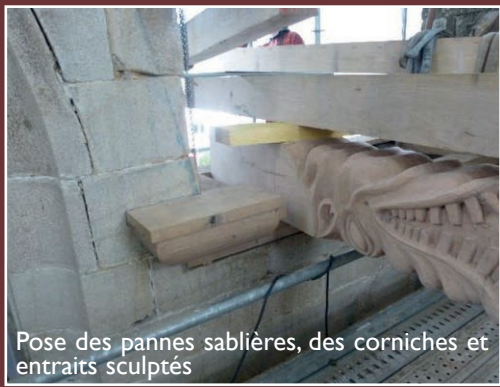
Pose des pannes sablières, des corniches et entrants sculptés

La seconde tranche de travaux concerne la deuxième partie de la nef et le porche sud. Elle débutera courant août.